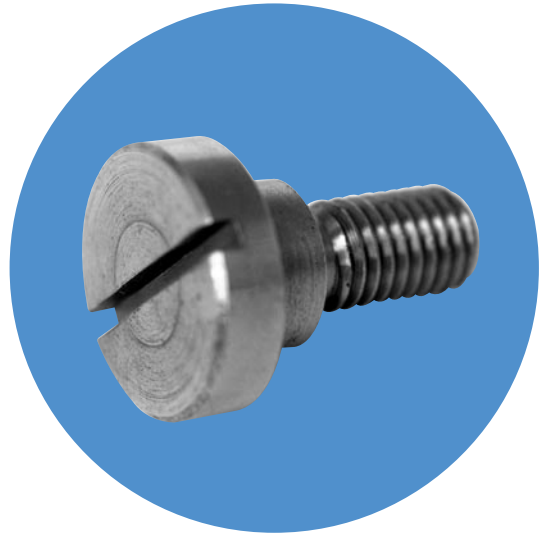
Flachkopfschrauben zu DIN 173 K und L